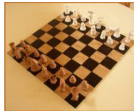
Le jeu d'échecs